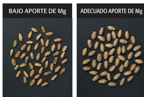
Fig. 2. Semillas de plantas de trigo cultivadas con bajo magnesio (izquierda) y adecuada fertilización con magnesio (derecha).

Por ejemplo, una publicación reciente indicó una reducción en el peso de la semilla de trigo desde 41 a 24 mg/semilla en un ambiente de crecimiento bajo en magnesio (Fig. 2).