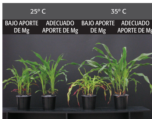
Fig. 3. Efecto de la temperatura y del suministro de magnesio en el crecimiento y desarrollo del maíz.

Un magnesio adecuado disponible en la planta mantiene una fotosíntesis óptima y reduce el estrés del cultivo debido a la alta radiación solar y la alta temperatura (Fig. 3).