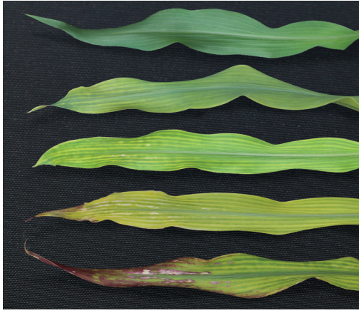
Fig. 4. Hojas de maíz con síntomas de deficiencia de magnesio debido a la disminución en el suministro de este elemento.